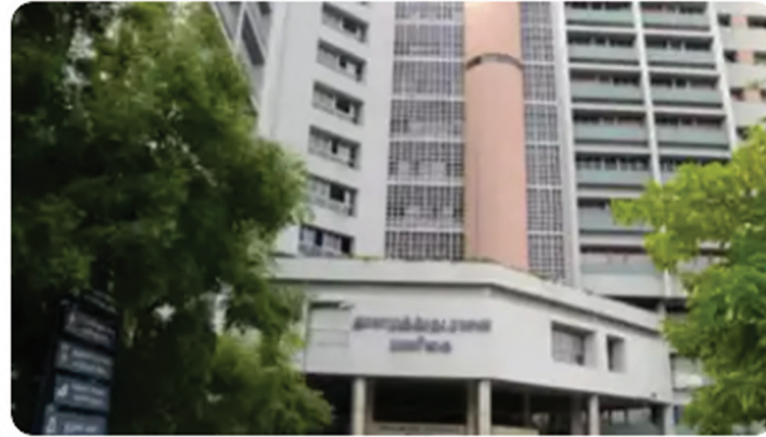
Chennai Metropolitan Development Authority

It is official. Chennai has expanded nearly five times from 1,189sqkm to 5,904sqkm. The state government on Friday issued the order to add 1,221 villages in Kancheepuram, Tiruvallur, Chengalpet and Ranipet districts under the Chennai Metropolitan Area (CMA).