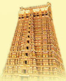
Sholingur Narasimha Temple